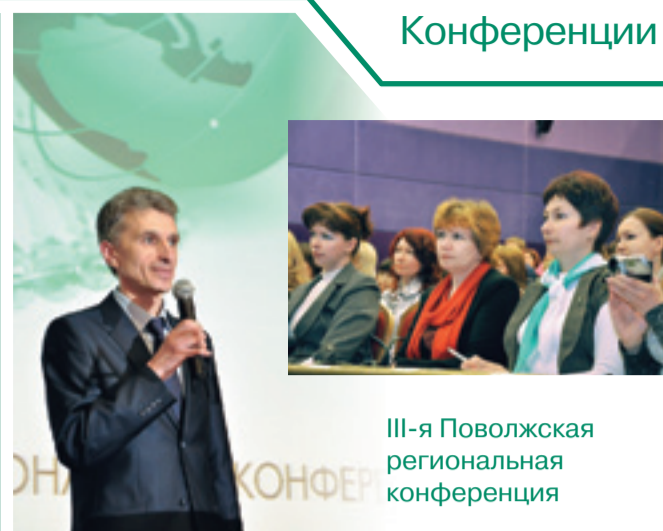
III-я Поволжская региональная конференция